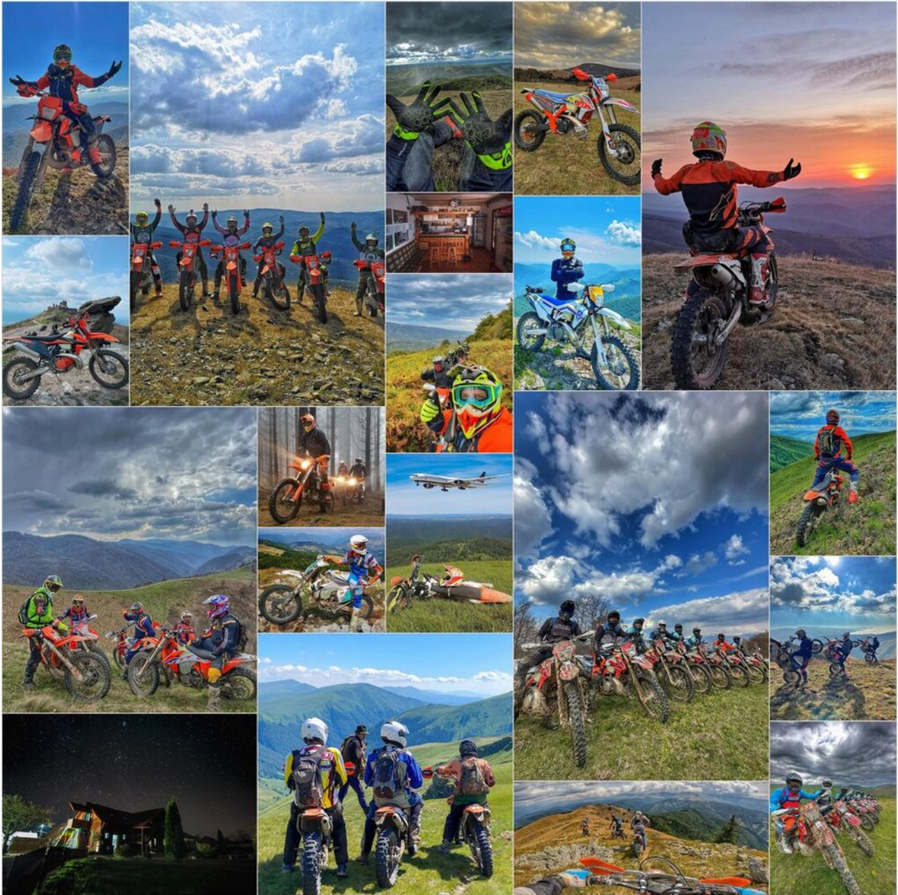
Fly and Ride Angebot von NoMud Adventures

Die langjährige Zusammenarbeit mit Nomud Adventures hat zu einem umfassenden Motorradservice vor Ort, Motorradverleih und Endurotraining geführt.