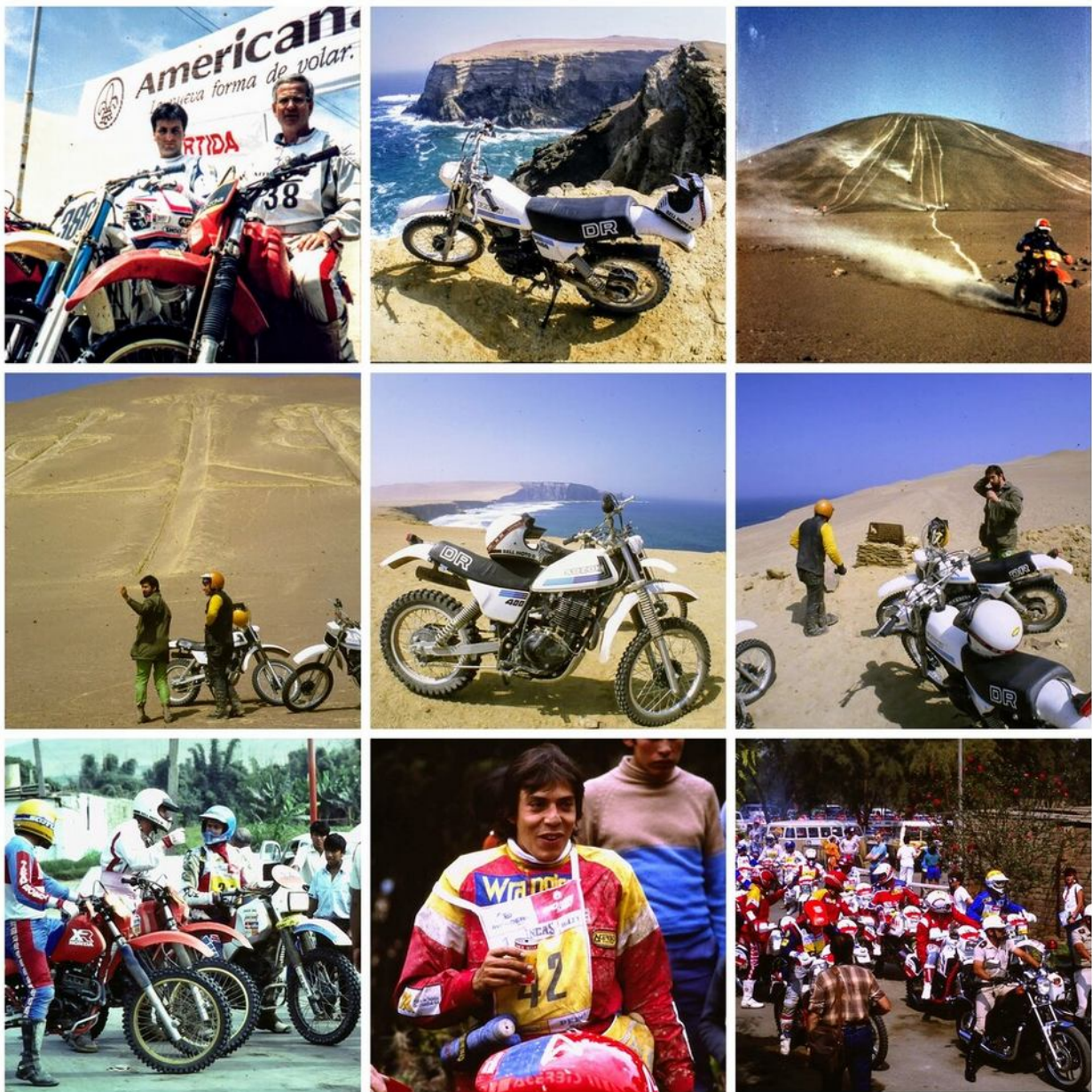
Endurowandern und Inkas Rallye in den 80er Jahren in Peru

Die Wüstentouren führten über sandige Pisten zu Rastplätzen, die von Lastwagenfahrern für den Warentransport entlang der Pazifikküste genutzt werden. Mittagspausen mit peruanischen Köstlichkeiten waren fester Bestandteil dieser Abenteuer. Manchmal unternahmen wir mehrtägige Touren in abgelegene Wüstengebiete und übernachteten in Zelten unter freiem Himmel. Wir organisierten sogar Rallies nach dem Vorbild der Baja California Rally, die wir Baja Paracas taufte.