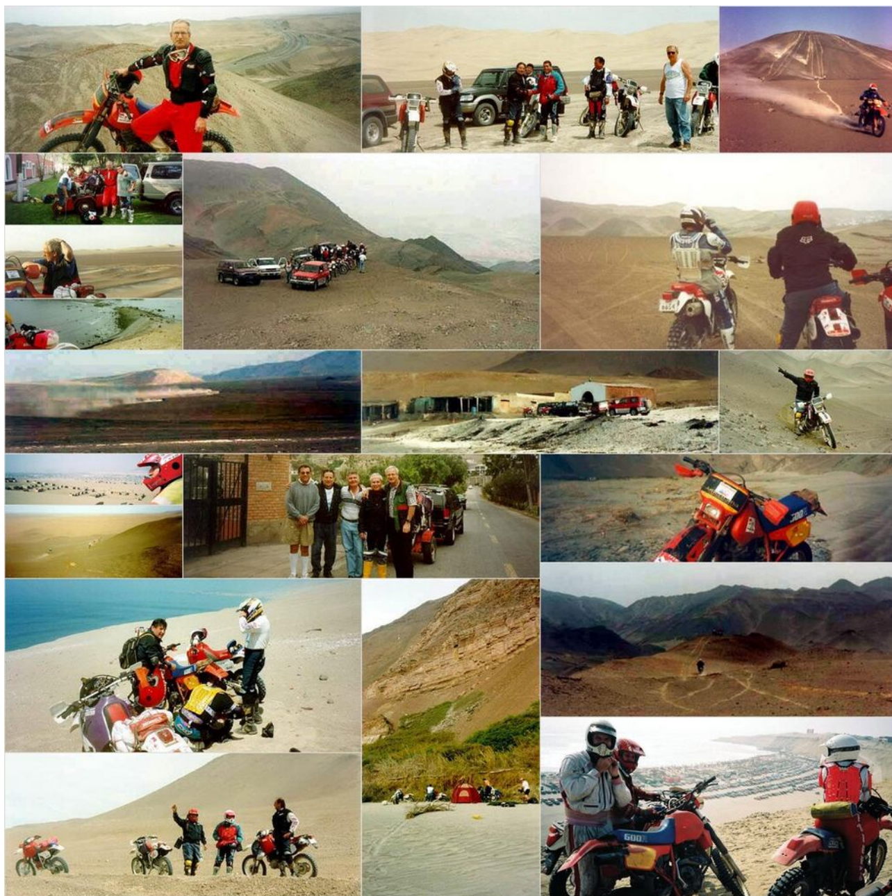
Endurowandern in den 90er Jahren in Peru

Nach meiner Rückkehr nach Europa im Jahr 1988 habe ich die Verbindung zu Peru aufrechterhalten und mit meinen peruanischen Freunden weiterhin Wüstentouren unternommen. Die Sehnsucht nach den spektakulären Wüstenlandschaften und die gemeinsamen Abenteuer ließen mich immer wieder zurückkehren, um die Schönheit und Herausforderung der peruanischen Wüsten zu erleben.