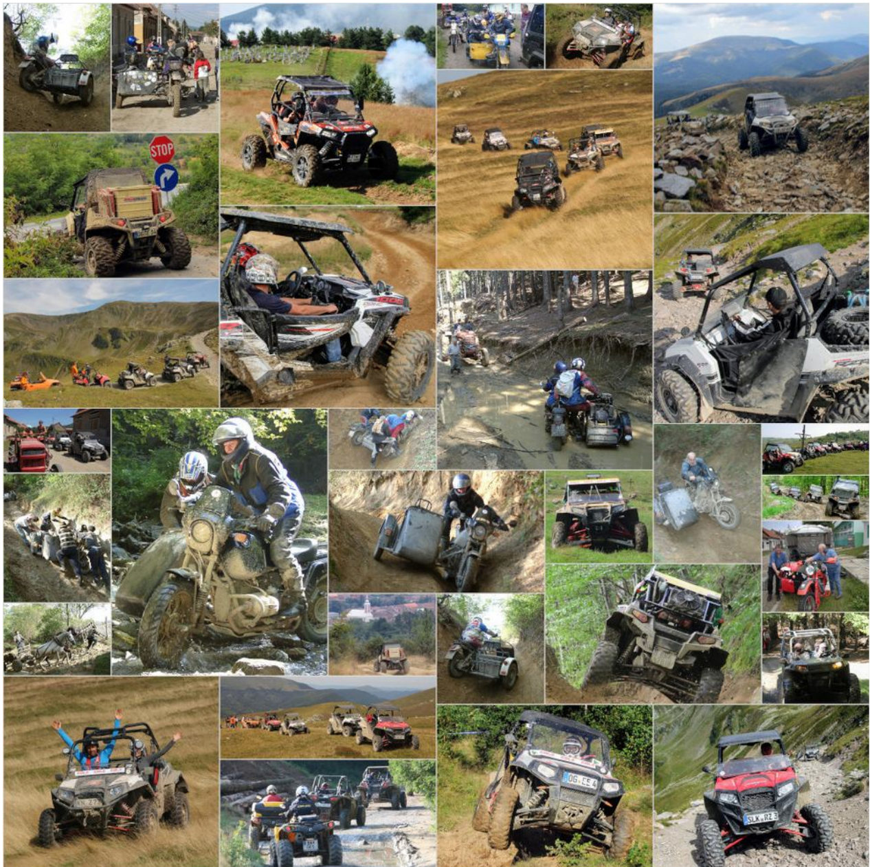
Buggy SxS & Enduro Enduro Gespanne

Die überwiegend deutschsprachigen Teilnehmer kommen aus Deutschland, Österreich, der Schweiz und verschiedenen europäischen Ländern. Die Vielfalt der Fahrzeuge, vom Mountainbike bis zum Geländetruck, spiegelt sich in der breiten Teilnehmerbasis wider. Auf Initiative des legendären Peter Römer (85) waren mehrere Jahre lang sogar exklusive Enduro-Gespann-Teams am Start. Die Markenlandschaft hat sich im Laufe der Zeit verändert, wobei KTM-Enduros deutlich an Präsenz gewonnen haben. Mit der Einführung des Buggy SxS im Jahr 2009 wurde nicht nur die Fahrzeugauswahl erweitert, sondern auch das sportliche Fahrerlebnis bereichert.