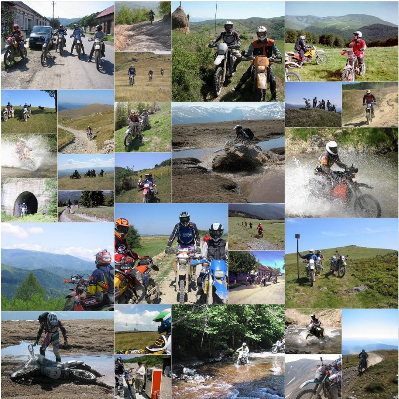
Ideal für Endurowandern