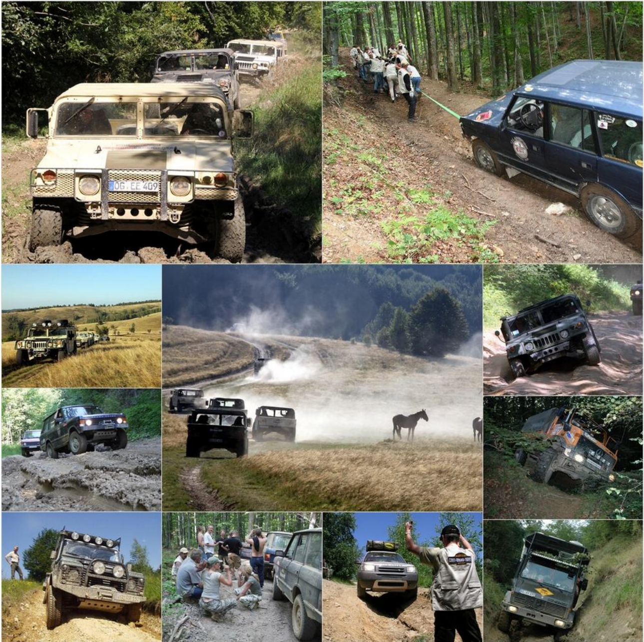
ContiRoMania Trophy Incentive Events

Zwischen 2004 und 2011 fanden im Rahmen der EnduRomania in Brebu Nou die sogenannten ContiRoMania Trophy Events statt, nachdem die Firma Continental aus Hannover in Timișoara ein Reifenwerk errichtet hatte.