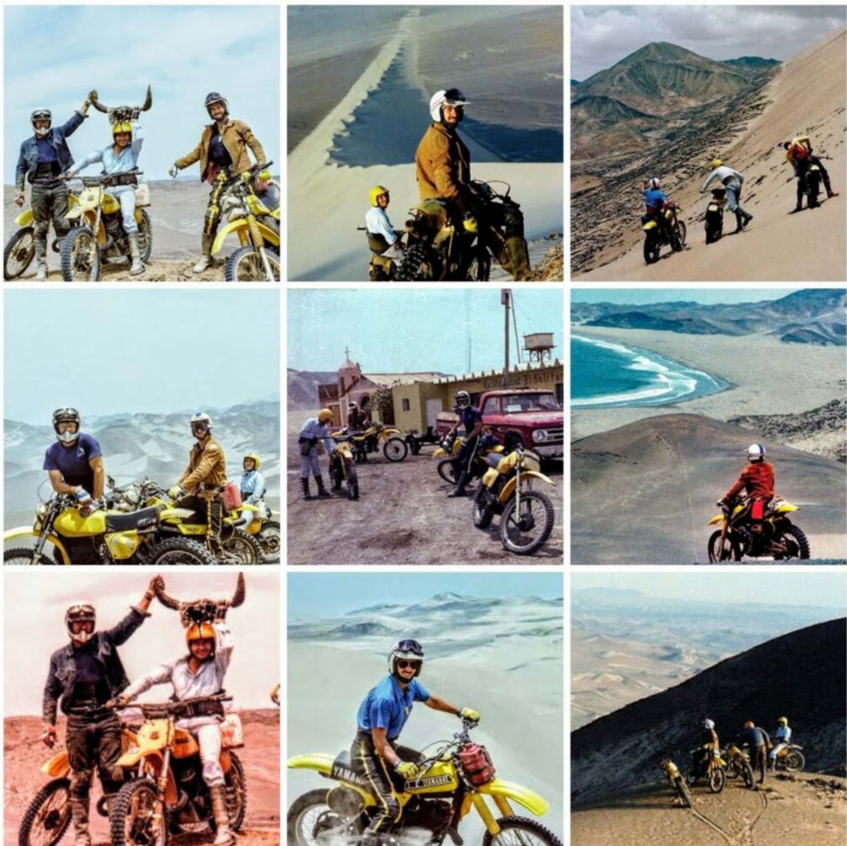
Endurowandern Ende der 70er Jahre in Peru

Unvergesslich sind die Bilder aus dieser Zeit, die zeigen, wie sich die Enduro-Freunde auf ihre Enduro-Motorräder schwingen, um die Wüste zu erobern. Zusammen mit anderen Enduro-Freunden gründeten wir den Club "Moto-Cross-Country del Peru" und nutzten jede Gelegenheit, um die Wüste zu erkunden. Wir starteten von Tankstellen an der Carretera Panamericana Nord oder Süd und entdeckten fast jedes Mal neue Gebiete.