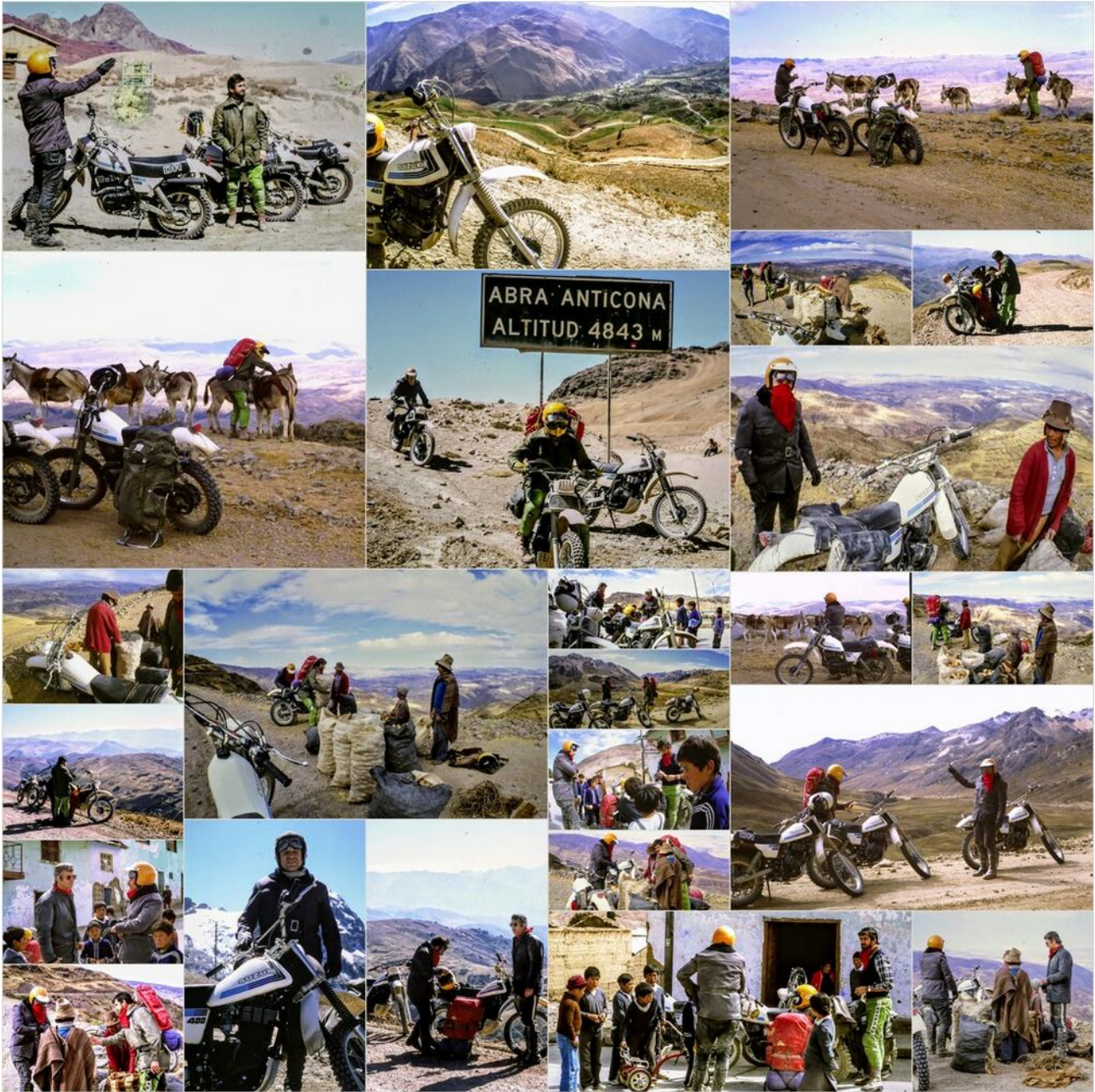
Endurowandern im Altiplano Peruano Gebiet

Wir wagten uns auch auf unbefestigte Straßen, die sogar Höhen von über 5000 Metern über dem Meeresspiegel erreichten, in die majestätischen Anden, wo schneebedeckte Gipfel und imposante Gletscher die Landschaft prägten. Diese Ausflüge boten eine faszinierende Abwechslung zu unseren Wüstenabenteuern und zeigten uns eine ganz andere Seite Perus.