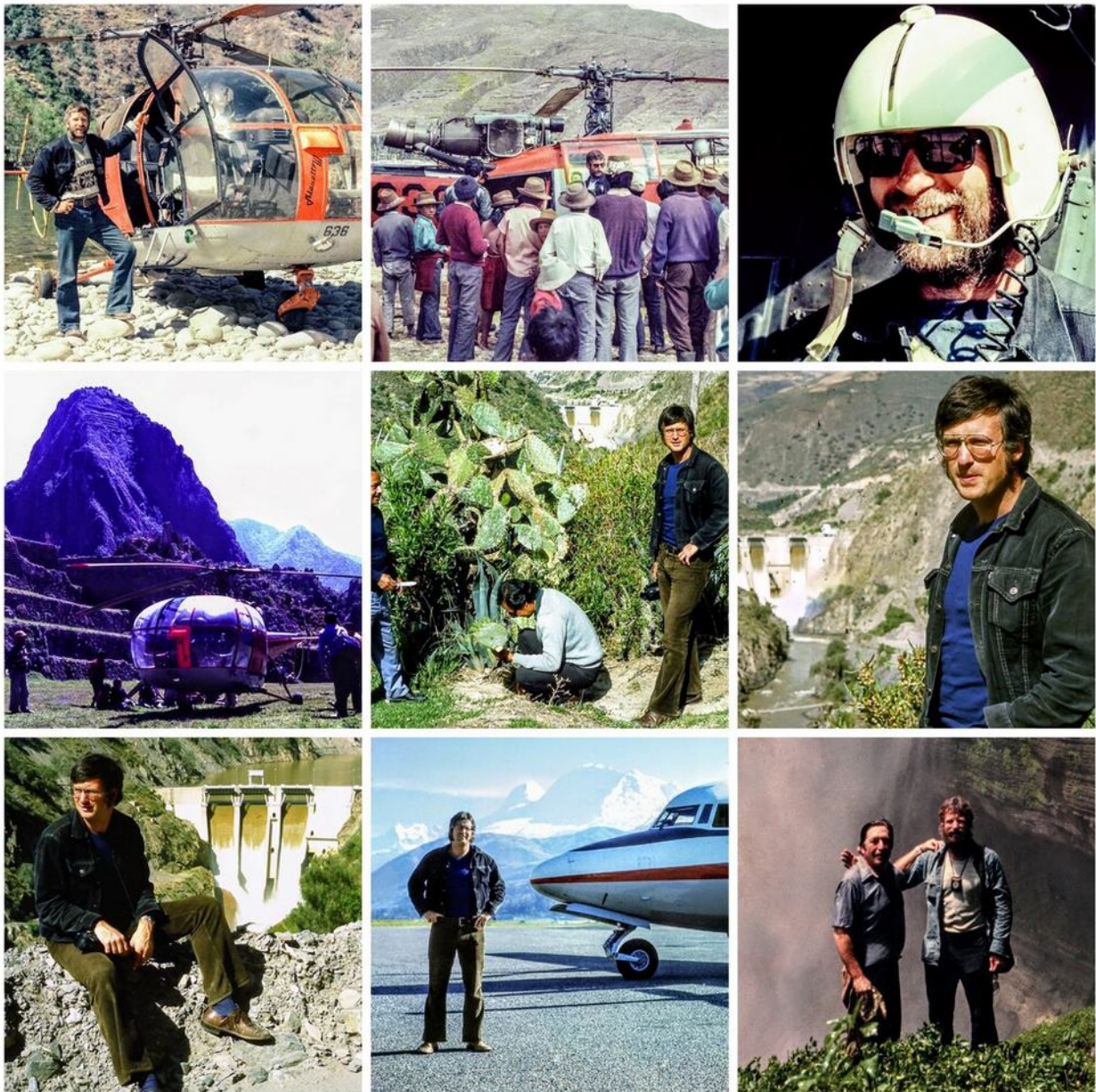
Berufliche Tätigkeit in Peru

Vor fünf Jahrzehnten begann meine faszinierende Reise durch die peruanische Wüste, eine Expedition in eine Welt, die die meisten Europäer bis heute nur aus Büchern und Filmen kennen. 1973 kam ich als junger Wasserwirtschaftsingenieur und Systemanalytiker nach Peru und fand mich bald inmitten dieser einzigartigen Wüstenlandschaft wieder, die mich von Anfang an in ihren Bann zog.