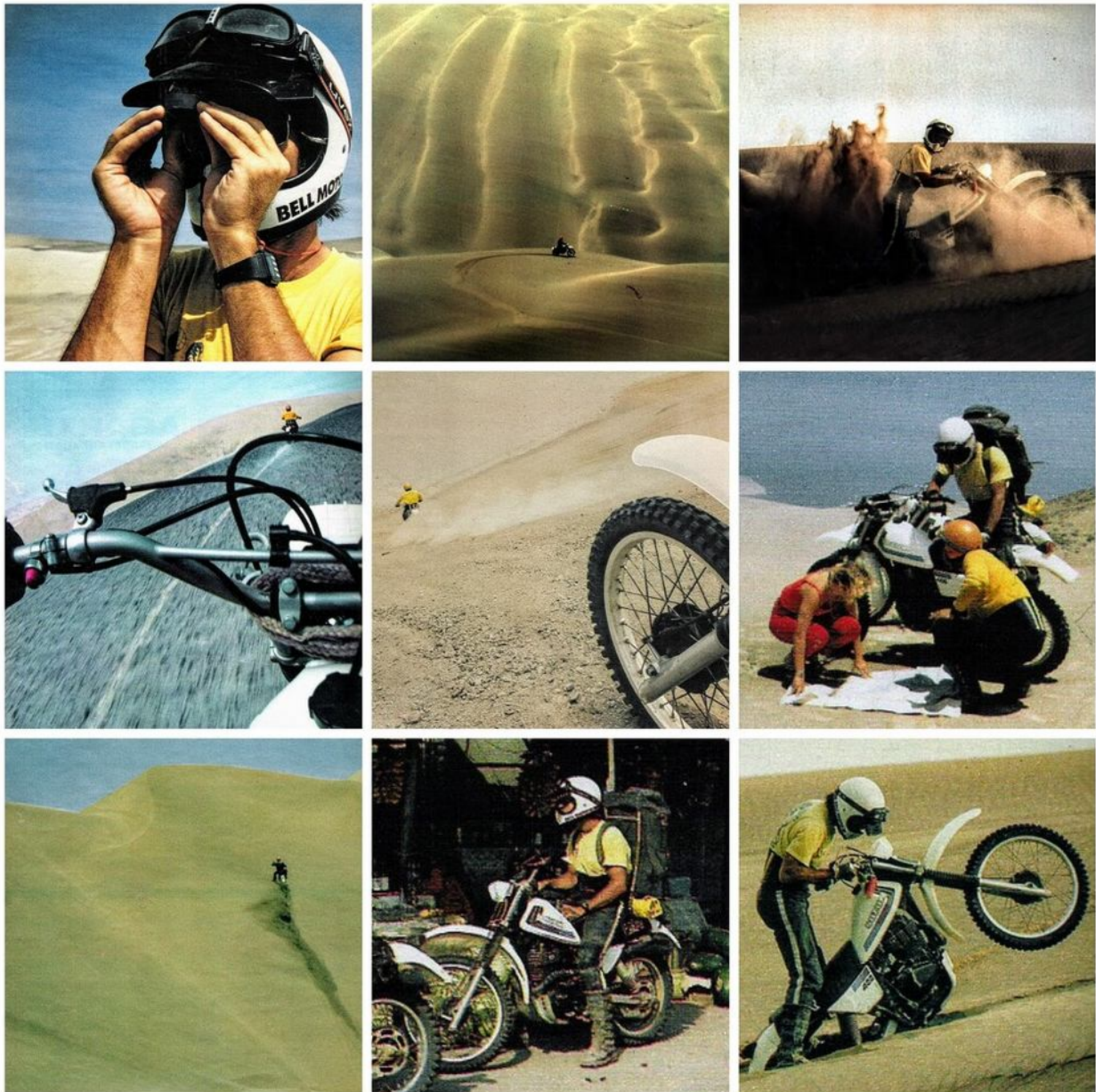
Fotoaufzeichnungen des Journalisten Reiner Nietschke in 1981

Bemerkenswert ist auch, dass ich aufgrund meiner Begeisterung für diese innovative Form des Enduro-Tourismus eine Möglichkeit witterte, sie mit dem für die internationale Zusammenarbeit der Bundesrepublik Deutschland typischen Geist der wirtschaftlichen Entwicklung zu verbinden. Umgesetzt wurde diese Idee durch die Aufnahme unserer Enduro-Touren in Peru in das Fly & Ride-Angebot des Reisebüros Schmalz in Altenkirchen, die von unserer Gruppe mit DR400R-Motorrädern durchgeführt wurden. Die journalistische Dokumentation dieses innovativen Übersee-Enduro-Tourismus-Angebotes übernahm 1981 der junge und talentierte Journalist Reiner Nietschke.